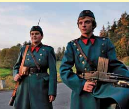
↑ Uniforemované fandby vojenské historie tu můžete potkat při zvláštních příležitostech

Rekonstrukční práce na objektu byly zahájeny v roce 1992 členy a příznivci Klubu vojenské historie Praha, kteří si pevnůstku od armády zdarma pronajali. Stav objektu byl však po dlouhých letech nevyužívání doslova žalostný. Objekt byl z části zasypan a zakryt náletovými dřevinami, interiér byl plný kamení a betonu, objekt zčásti poničily odstřely v roce