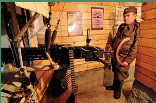
↓ Prostor levé střílny s vybavením

na 1938 bylo na 112 km dlouhé linii kolem Prahy zbudováno 35 km těžkých protitankových překážek, dalších 25 km překážek lehkých, staveb-