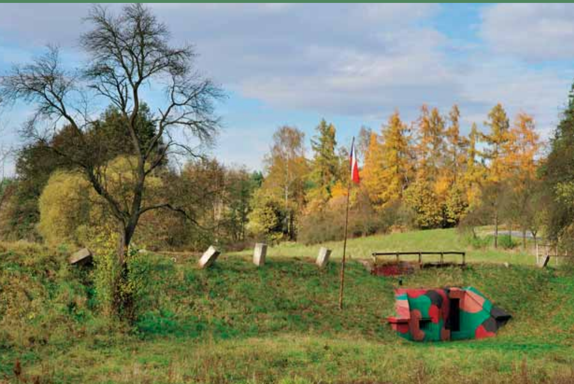
↑ Atypický objekt a muzeum opevnění pod silnicí Bratronice – Dolní Bezděkov

Opevnění však nebylo budováno jen v pohraničí, jak je dnes všeobecně známo, ale bylo vyprojektováno i několik vnitrostátních příček, které měly nepříteli ztížit případný postup republikou. Příčky vyprojektované napříč Moravou a přes Českomoravskou vrchovinu zůstaly jen na papíře a v důsledku obsazení republiky se s jejich výstavbou ani nezačalo.