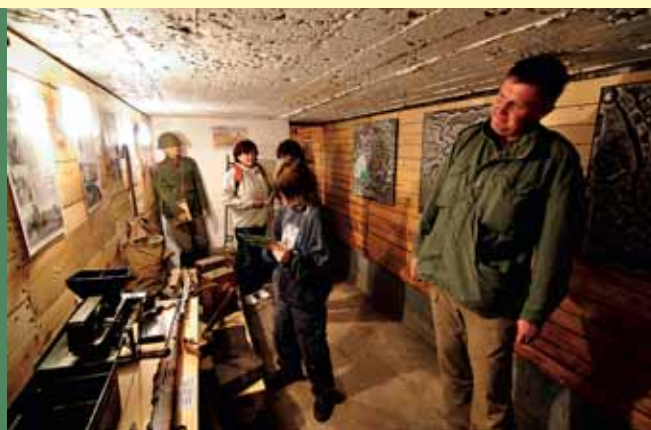
↑ I přes jistou odlehlost od civilizace je muzeum při pěkném počasí hojně navštěvováno.