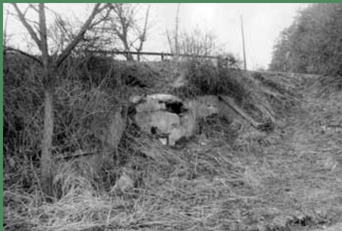
↑ Stav objektu byl před zahájením rekonstrukčních prací doslova beznadějný. Situace z počátku 90. let 20. století.

1939, při kterých se Němci snažili vytrhnout ocelové střílny. Rekonstrukční práce započaly vyrubáním interiéru řopíku, které za pomoci pronajaté sbíječky trvalo s přestávkami téměř 2 roky. Z jiného zničeného objektu na Šumavě byla získána chybějící střílna, časem byl doplněn i další původní inventář. V roce 1995 se podařilo napojit objekt na přívod elektrické energie, čímž se další práce značně zjednodušily. Řopík bylo nutno odizolovat proti pronikající spodní vodě, byla osazena nová výdřeva, do interiéru se vrátily součásti původního vybavení. V neposlední řadě dostal řopík novou omítku a původní maskovací nátěr.