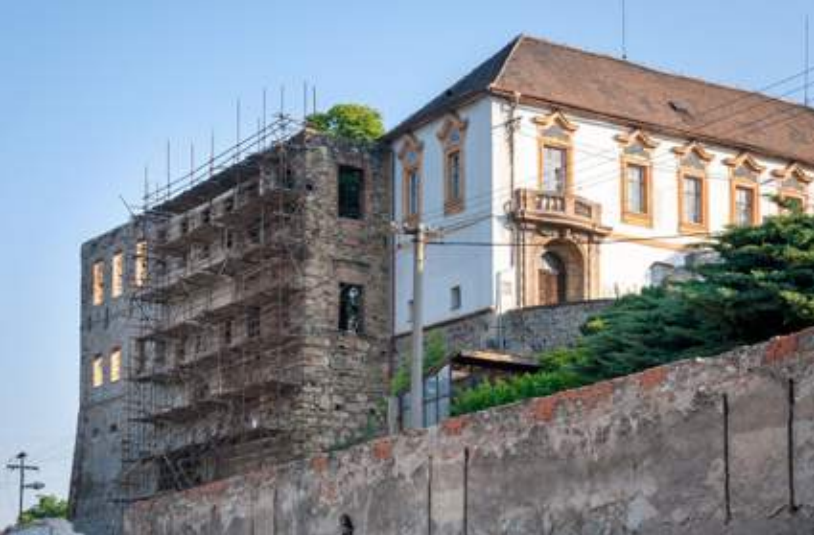
↑ Zbytky hradu ve Chvatěrubech

k řece značená povltavská cyklotrasa č. 7. Kiosek u přívozu nabízí možnost občerstvení. Na skále nad protějším břehem se dají najít nepatrné zbytky hradu Liběhrad. Od přívozu vede jedna větev naučné stezky do nedalekých Máslovic, kde lze navštívit známé muzeum másla. O otevřené době se předem informujte na webových stránkách obce. Kousek od přívozu poutá pozornost budova Výzkumného ústavu včelařského.