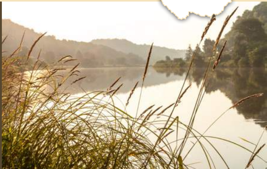
↑ Ráno u Vltavy