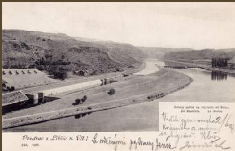
↑ Nová plavební komora s jezem v Dolánkách na pohlednici z počátku 20. století.

Celou popisovanou oblast i s okolím zachycují mapy edice KČT č. 9 a 16.