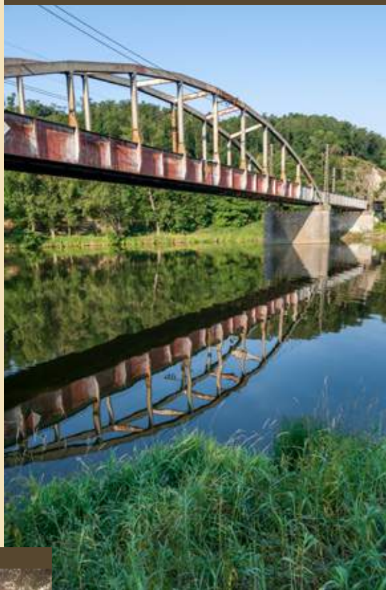
↑ Železniční most přes Vltavu nedaleko Kralup

Kolem skalního výchozu, vzniklého částečným odštěpením svahu v bývalém kamenolomu, se dostanete k dalšímu přívozu, který spojuje Řež a Husinec s protější břehem. Pokračujete po červené značce do Řeže až k rozcestníku Řež – žst., kde se dá po lávce přes Vltavu dostat k železniční zastávce a opět využít vlakové spojení s Prahou.