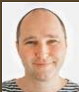
↑ Text a foto: Vojtěch Pavelčík