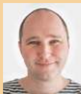
↑ Text a foto: Vojtěch Pavelčík

To, že je Česká republika rájem rozhleden, již dnes asi nikoho nepřekvapí. V posledním desetiletí se opravilo, obnovilo a postavilo rozhleden opravdu hodně a tento boom se nevyhnul téměř žádné části republiky. Rozhlednová horečka nakonec dorazila i na Moravské Slovácko, přesněji řečeno na Uherskobrodsko.