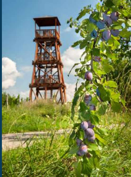
↑ Rozhledna Hraběcí stojí na okraji Vlčnovských vinohradů a nedaleko památkové rezervace Vlčnovské budy.

Již delší dobu se také plánuje výstavba rozhledny na vrchu Myšince mezi Vlčnovem a Drslavicemi. Z finančních důvodů k výstavbě zatím nedošlo. Je to škoda, protože výhled by zde byl kruhový na všechny okolní obce a na panorama Bílých Karpat. Rozhledna by měla stát přesně