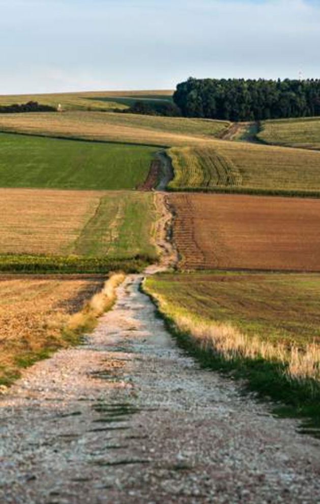
↑ Stará Hraběcí cesta vás přivede od hlavní silnice Uherský Brod – Vlčnov až k samotné rozhledně Hraběcí.

Dřevěnou dvoupatrovou věž najdete nedaleko Bojkovic, jmenuje se Na Skalce a poskytuje výhled jen západním směrem na Bojkovice, Javořinu a Bílé Karpaty.